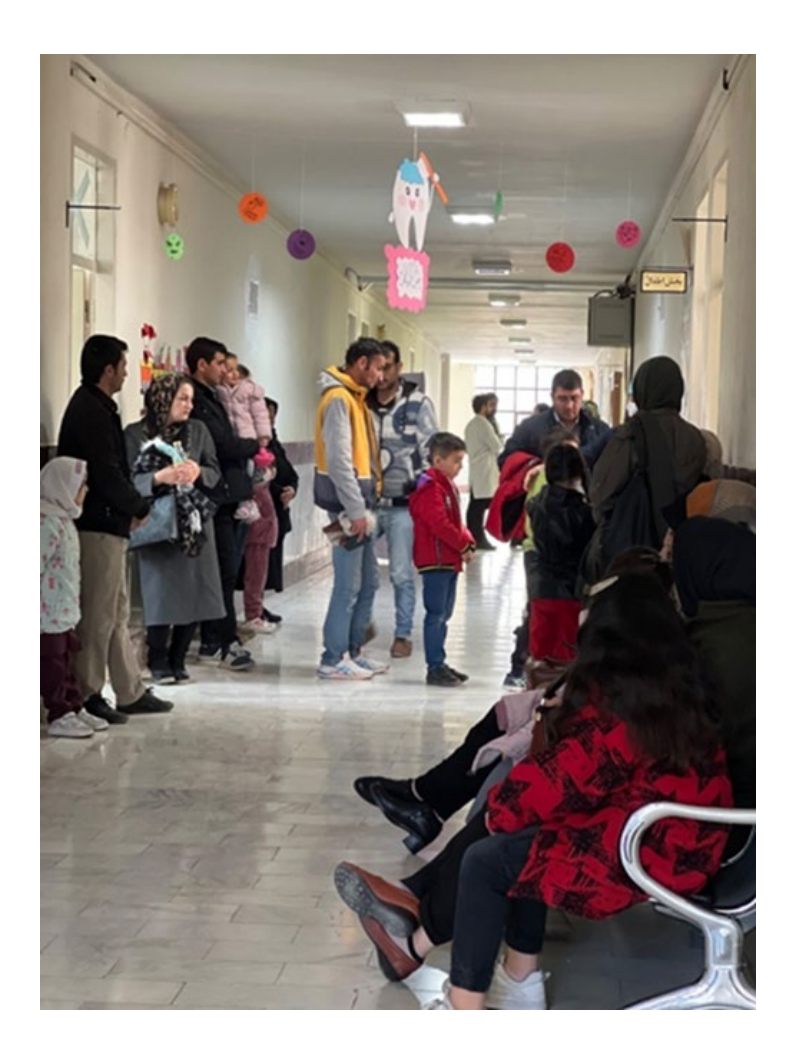
Figure S9: Referral of patients for the treatment of complex cases of MIH at the third level of service following a telephone invitation (dental faculty, specialized dental hospital)