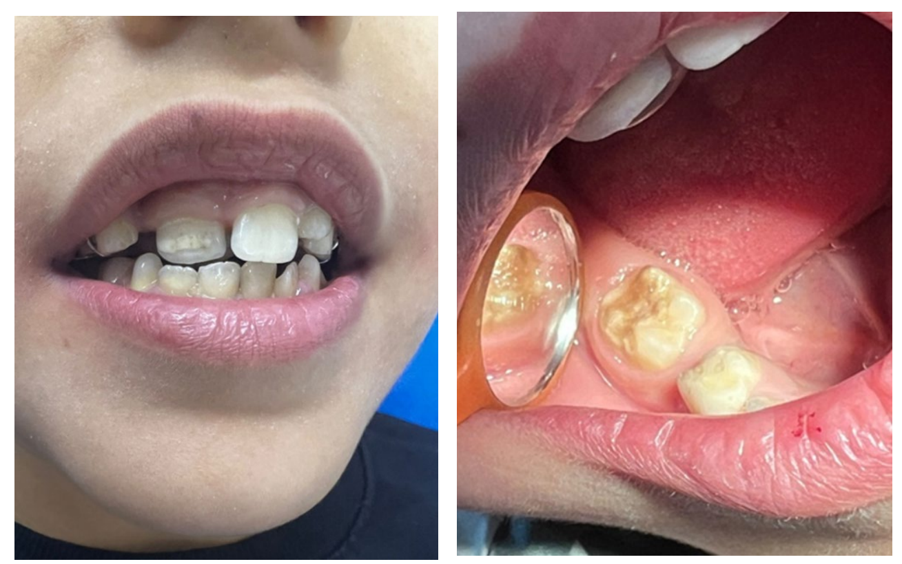
Figure S6: Documentation of teeth with MIH (permanent molar teeth, upper right central teeth)