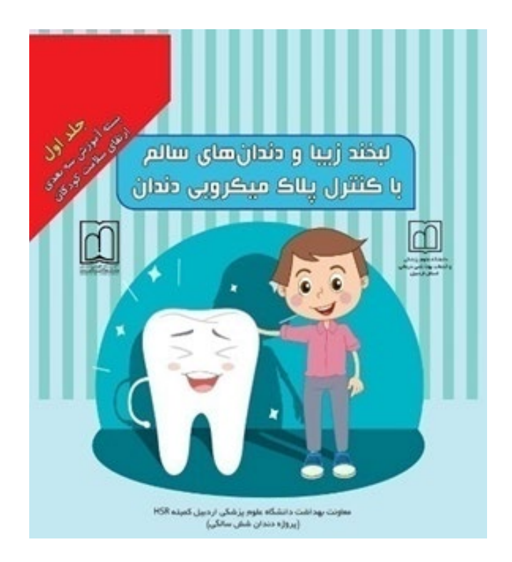
Figure S1 : educational material for children

10.34172/johoe.2403.1634 JOHOE. 2025;14:2403.1634